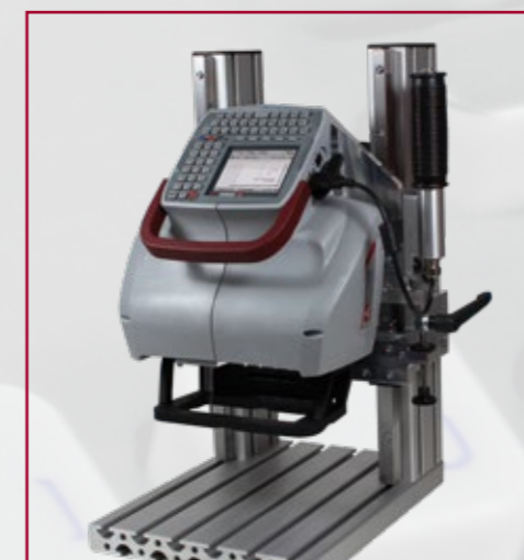
Opcionális jelölőgép állvány a kisalkatrészek jelölésére (opcionális)