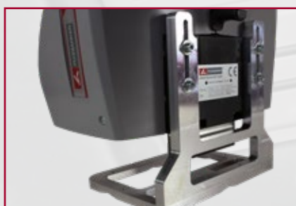
Levehető pozícionáló lemez (opcionális)