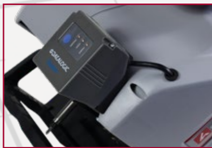
Beépített kódolvasó (opcionális)