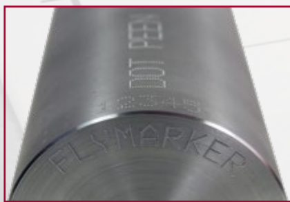
Íves alkatrész jelölése